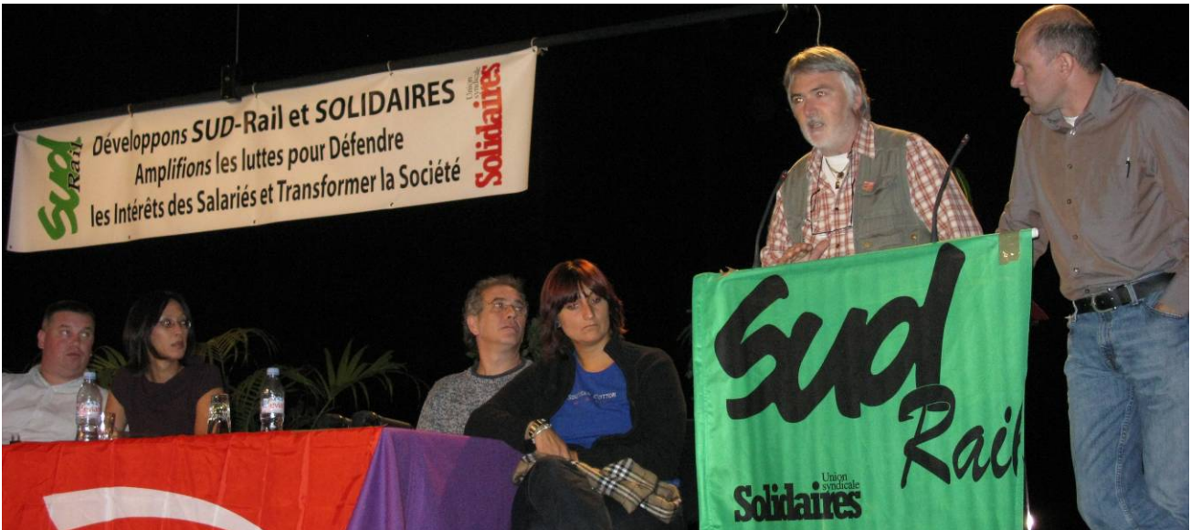
vlnr: die KollegInnen von RMT England, ORSA Italien, Officina Bellinzona Schweiz,

In Frankreich steht die Privatisierung des Personen- wie Frachtverkehrs auf der Tagesordnung, einhergehend mit der Aufspaltung des einheitlichen Bahnunternehmens SNCF in viele Tochterunternehmen und Filialen. Die Sud - Rail organisiert alle Beschäftigten, die direkt bei der Bahn wie auch für die gesamten Aktivitäten im Bereich der Bahn tätig sind. Das sind Lokführer, technisches Personal und Bahnhofspersonal genauso wie die Sans-Papiers - KollegInnen des Wachpersonals an und in den Bahnhöfen, die bei privaten Unternehmen arbeiten, wie auch die Bahnreiniger in den Zügen. Von daher treffen sich bei einem solchen Kongress KollegInnen aus sehr verschiedenen Arbeitswelten, aber auch aus sehr unterschiedlichen lokalen und regionalen Zusammenhängen. Es ist einfach ein recht großer Unterschied, und der wird gerade auch auf einem solchen Kongress spürbar – und thematisiert, zwischen der Tätigkeit auf einem der großen Bahnhöfe in Paris oder Marseille oder in einem der eher kleineren Städte.