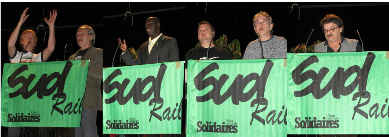
Tie, Bahn von unten BRD

In Frankreich steht die Privatisierung des Personen- wie Frachtverkehrs auf der Tagesordnung, einhergehend mit der Aufspaltung des einheitlichen Bahnunternehmens SNCF in viele Tochterunternehmen und Filialen. Die Sud - Rail organisiert alle Beschäftigten, die direkt bei der Bahn wie auch für die gesamten Aktivitäten im Bereich der Bahn tätig sind. Das sind Lokführer, technisches Personal und Bahnhofspersonal genauso wie die Sans-Papiers - KollegInnen des Wachpersonals an und in den Bahnhöfen, die bei privaten Unternehmen arbeiten, wie auch die Bahnreiniger in den Zügen. Von daher treffen sich bei einem solchen Kongress KollegInnen aus sehr verschiedenen Arbeitswelten, aber auch aus sehr unterschiedlichen lokalen und regionalen Zusammenhängen. Es ist einfach ein recht großer Unterschied, und der wird gerade auch auf einem solchen Kongress spürbar – und thematisiert, zwischen der Tätigkeit auf einem der großen Bahnhöfe in Paris oder Marseille oder in einem der eher kleineren Städte.