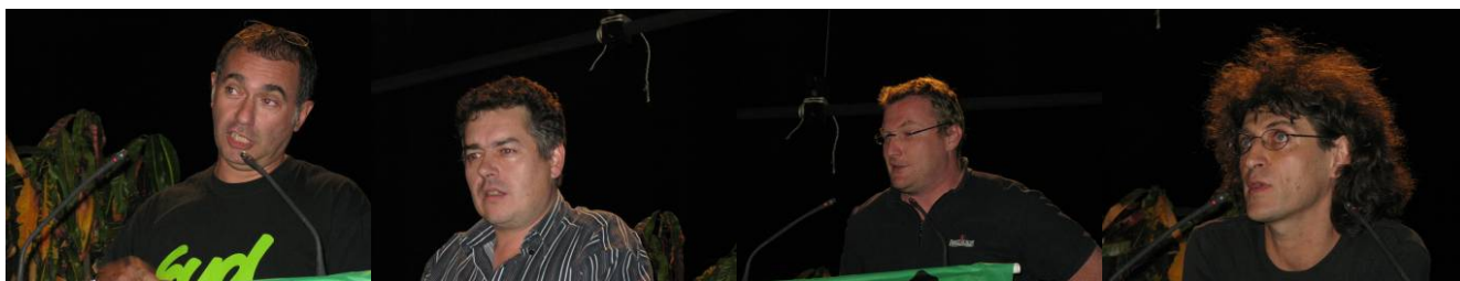
KandidatInnen der Sektionen und späteren Mitglieder des neuen Vorstands