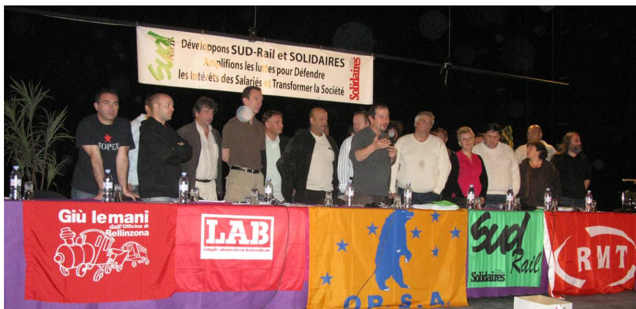
Der alte und der neue Vorstand von Sud-Rail

Sud-Rail und Solidaires entwickeln - die Kämpfe verbreitern für die Verteidigung der Interessen der Lohnabhängigen und die Transformation der Gesellschaft